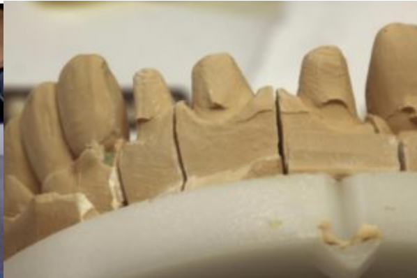
Så här blir modellen