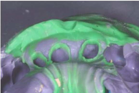
Avtryck med släp

Se även bilden på vad det gör med arbetsmodellen. Det här är en tydlig felkälla då vi som tekniker måste radera på preppen.